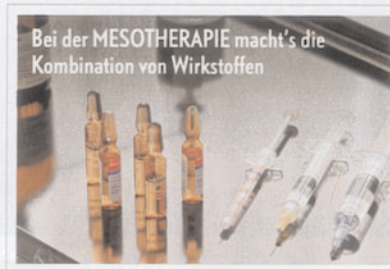
Bei der MESOTHERAPIE macht's die Kombination von Wirkstoffen

Kosten: Mesotherapie ca. 150 Euro, mit Lipostabil ca. 250 Euro. Infos: www.mesotherapie.org